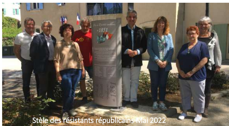
Stèle des résistants républicains Mai 2022