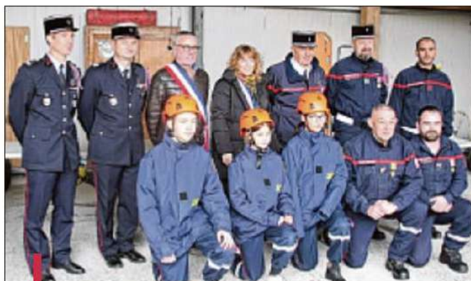
La cérémonie s'est déroulée samedi.