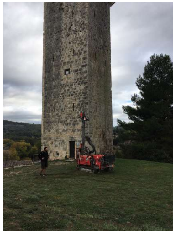
Travaux de carottage 10 novembre

Le conseil a souhaité s'engager dans une démarche de travaux dans les bâtiments communaux, avec entre autre la réduction de la consommation d'énergie par une meilleure isolation. En 2023 un dossier de demande de fonds de l'état sera déposé pour la rénovation des portes-fenêtres et fenêtres de la mairie, salle polyvalente, cabinet médical et logement communal.