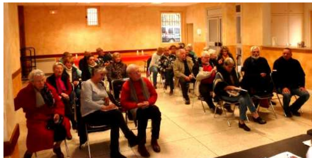
Assemblée générale de janvier