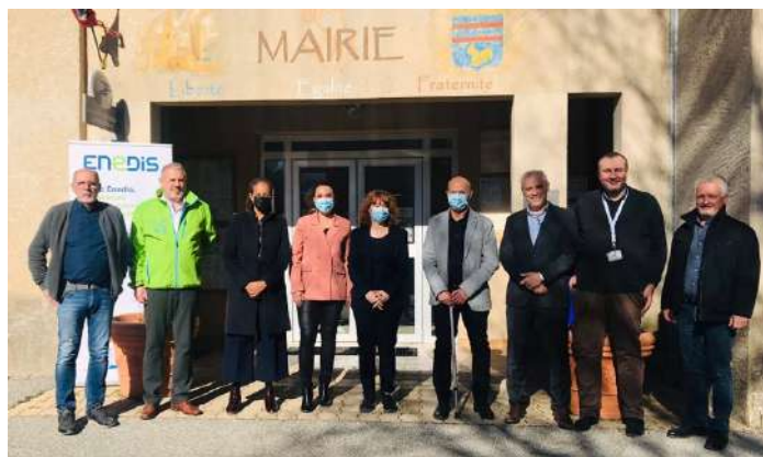
Inauguration antenne 4G février 2022