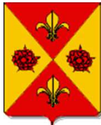
Blason des Gasqui de Manosque, marquis de Brégançon