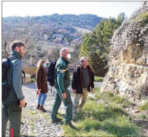
Le bâtiment ne présente pas de danger d'effondrement, mais commence à pencher.

Des études vont donc être menées afin de vérifier la stabilité de la tour, pour éviter que l'on "se croie à Pise". Des travaux d'études de sol et de structure de la Tour de l'horloge ont été demandés, sous le contrôle du service monument historique de la Drac. Ce chantier d'études