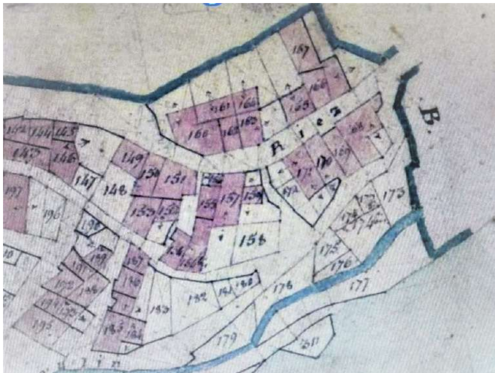
En haut au centre de 160 à 164

Charles Ordinis, Nobiliaire de Provence par René Borricand, Armorial de Jean-Baptiste Rietstap, Sites : Genobco, Jean Gallian de 2011 et les Archives Départementales du 04.