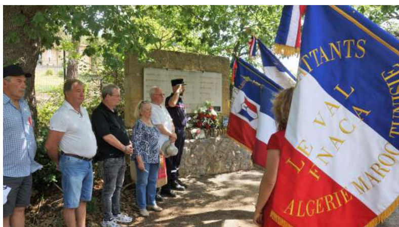
Vallon des bayles 16 juin 2022