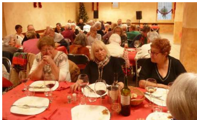
Repas de Noël