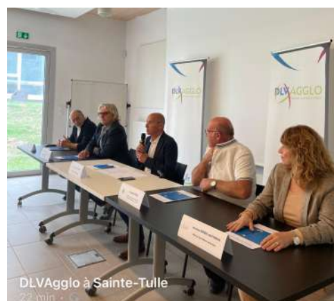
DLVAgglo à Sainte-Tulle