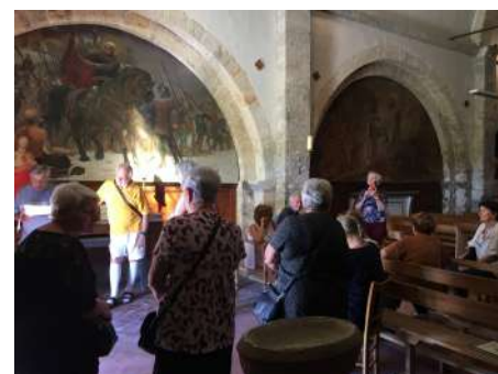
Journées du Patrimoine