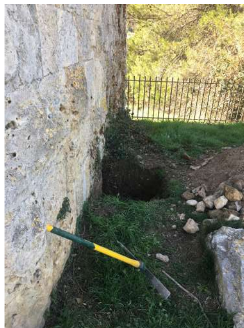
Sondages nord de la tour Janvier 2023