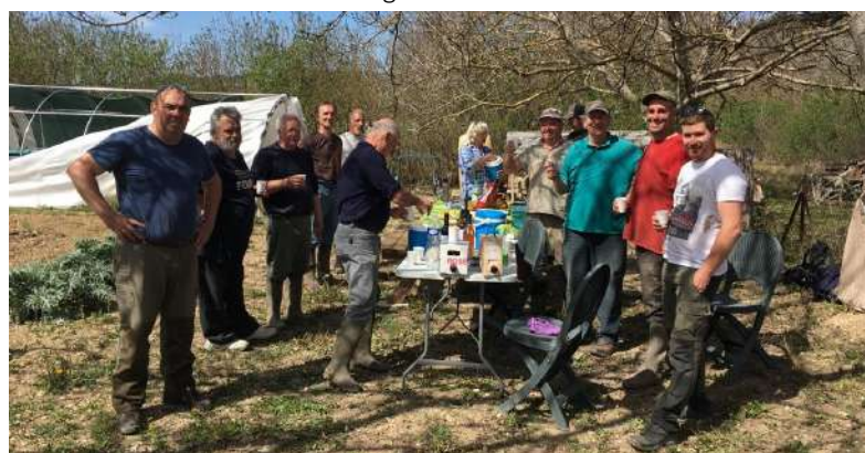
Entretien du canal du Colostre printemps 2022