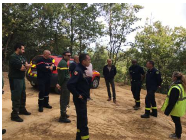
Travaux piste DFCI DLVAgglo