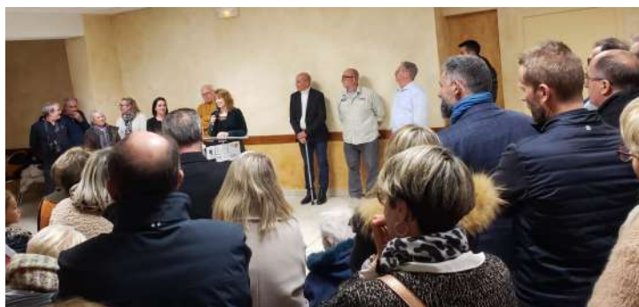
Cérémonie des vœux du 20 janvier