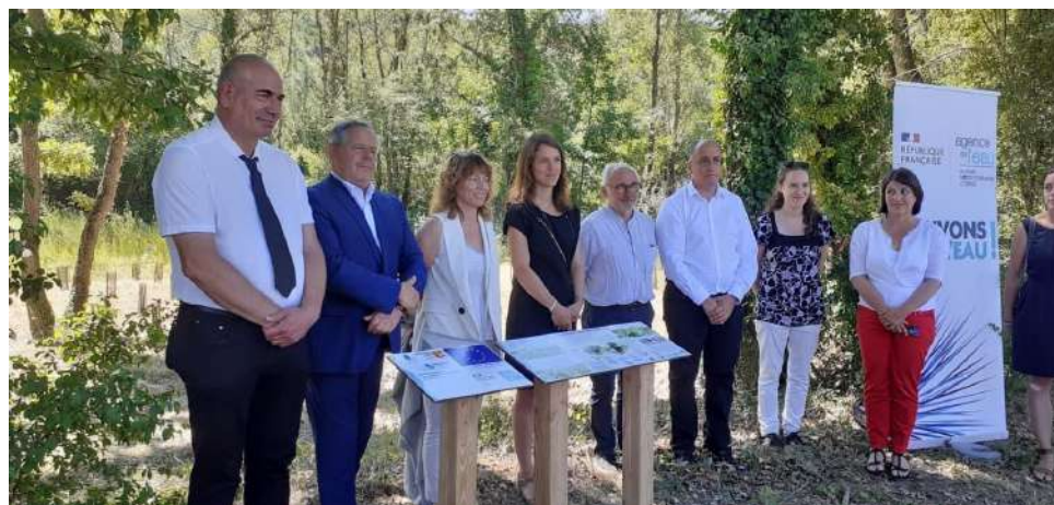
1er juillet 2022 inauguration du Colostre