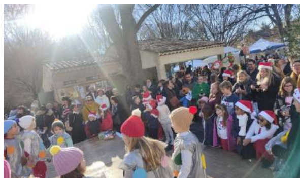
Marché et fête de Noël