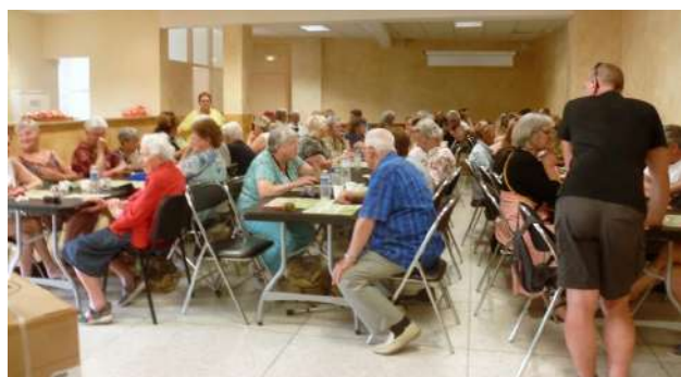
Loto du 25 mai 2022