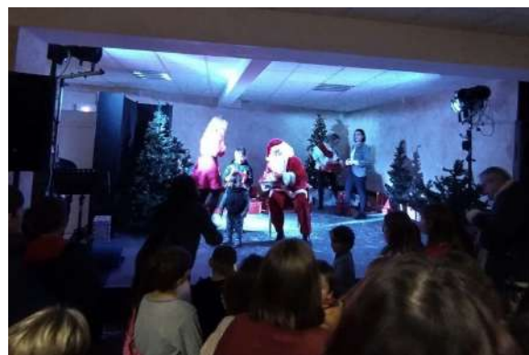
Distribution des cadeaux aux enfants

Un grand merci à tous et à toutes pour ce soutien actif.