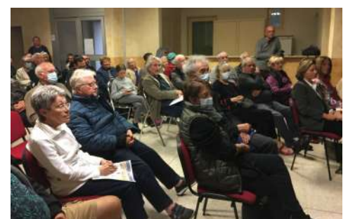
Conférence du Buffe Arnaud par D. Garcia