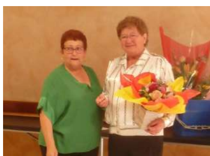
Les anniversaires le 18 octobre 2022