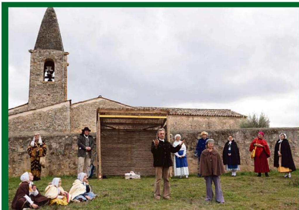
Les 28 comédiens d'un soir joueront l'histoire de la Nativité dans quatre lieux différents du village.

PASTORALE Action, les santons vivants jouent leur pastorale ce soir à 17 h 15